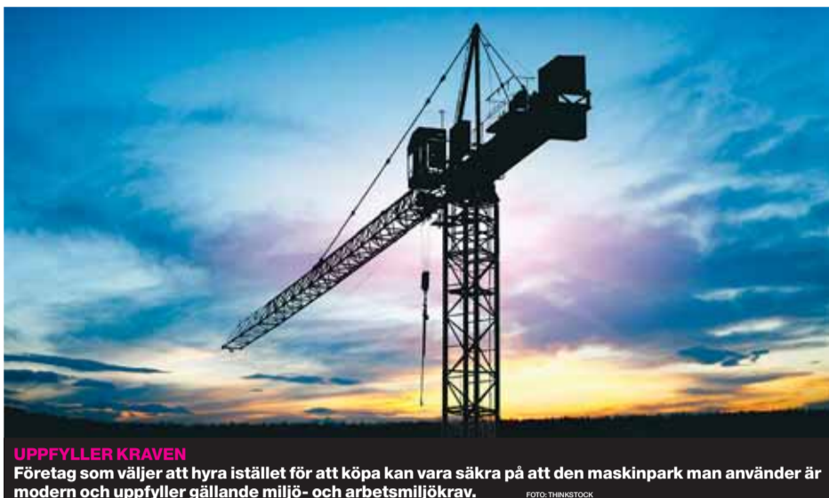
UPPFYLLER KRAVEN Företag som väljer att hyra istället för att köpa kan vara säkra på att den maskinpark man använder är modern och uppfyller gällande miljö- och arbetsmiljökrav.